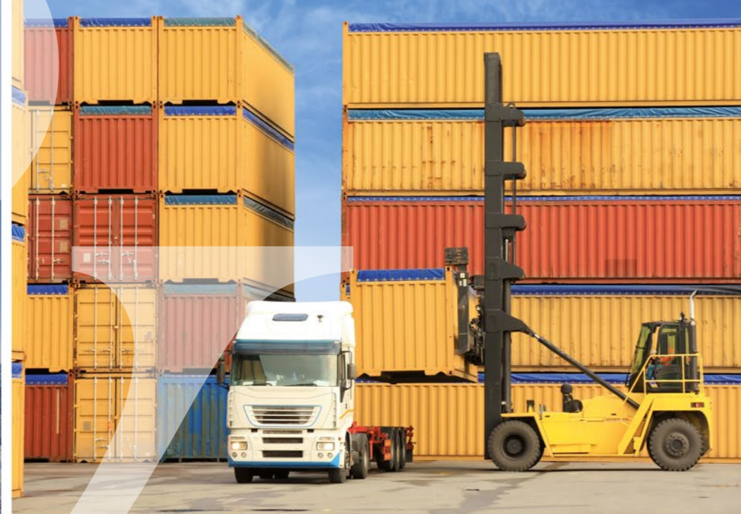
commissariat d'avaries | expertises maritimes, terrestres & industrielles