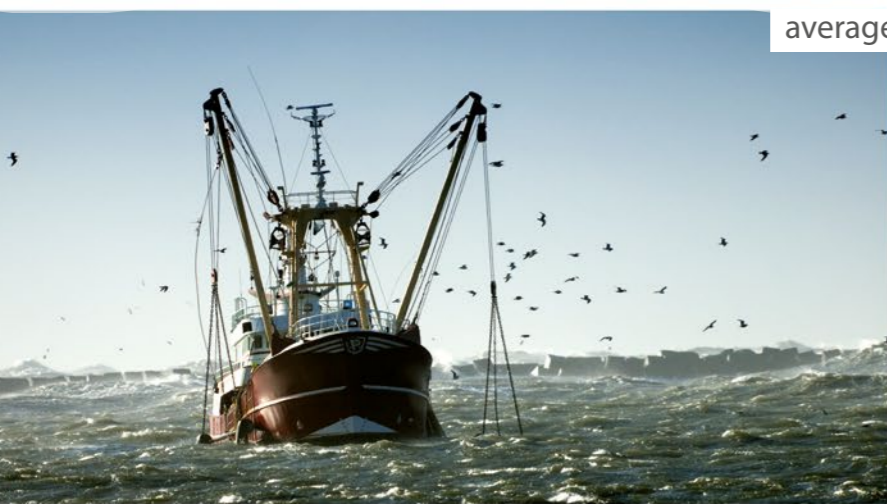
average adjusters | marine, road & industrial surveyors